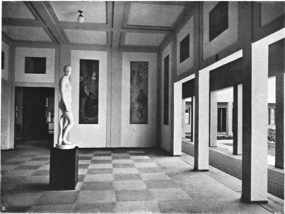
Eingangshalle der Schweizerischen Werkbund-Ausstellung. Plastik von Paul Oßwald, Bildhauer S. W. B., Zürich. Wandmalereien von Carl Rösch S. W. B., Dießenhofen

des einheimischen nationalen Gewerbes. Das bezweckt auch der Schweizerische Werkbund; er ist wirtschaftlich von den übrigen genannten Werkbund-Gründungen unabhängig. Er hat die einheimische Produktion bis dahin durch Wander-Ausstellungen, Vorträge, Flugschriften und Wettbewerbe zu fördern gesucht. Daß diese Werbetätigkeit nötig ist, zeigt die heute leider zunehmende Vorliebe für alte Möbel, Bilder und Gegenstände, gleichviel ob solche echt seien, oder ob sie die Spezial-Fabriken als Imitationen hergestellt und hernach in den Handel gebracht haben. Noch dringender wird die Aufklärung, wenn wir sehen, wie alte gute Vorbilder nachgeahmt und in einem modernisierten Gewand mit dem Schlagwort „Vom allerneuesten“ an den Käufer gebracht werden. Diese Stilrichtungen sind der Mode unter-