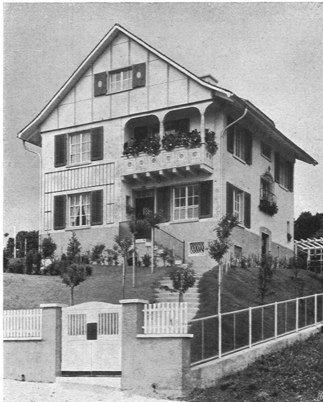
Haus mit Giebel- verkleidung aus Eternit

Rittmeyer & Furrer Archit. B. S. A. Winterthur