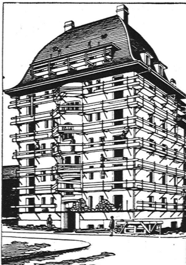
Ansicht eines eingerüsteten Hauses

Einfachstes und schnellstes Verfahren im Eingerüsten