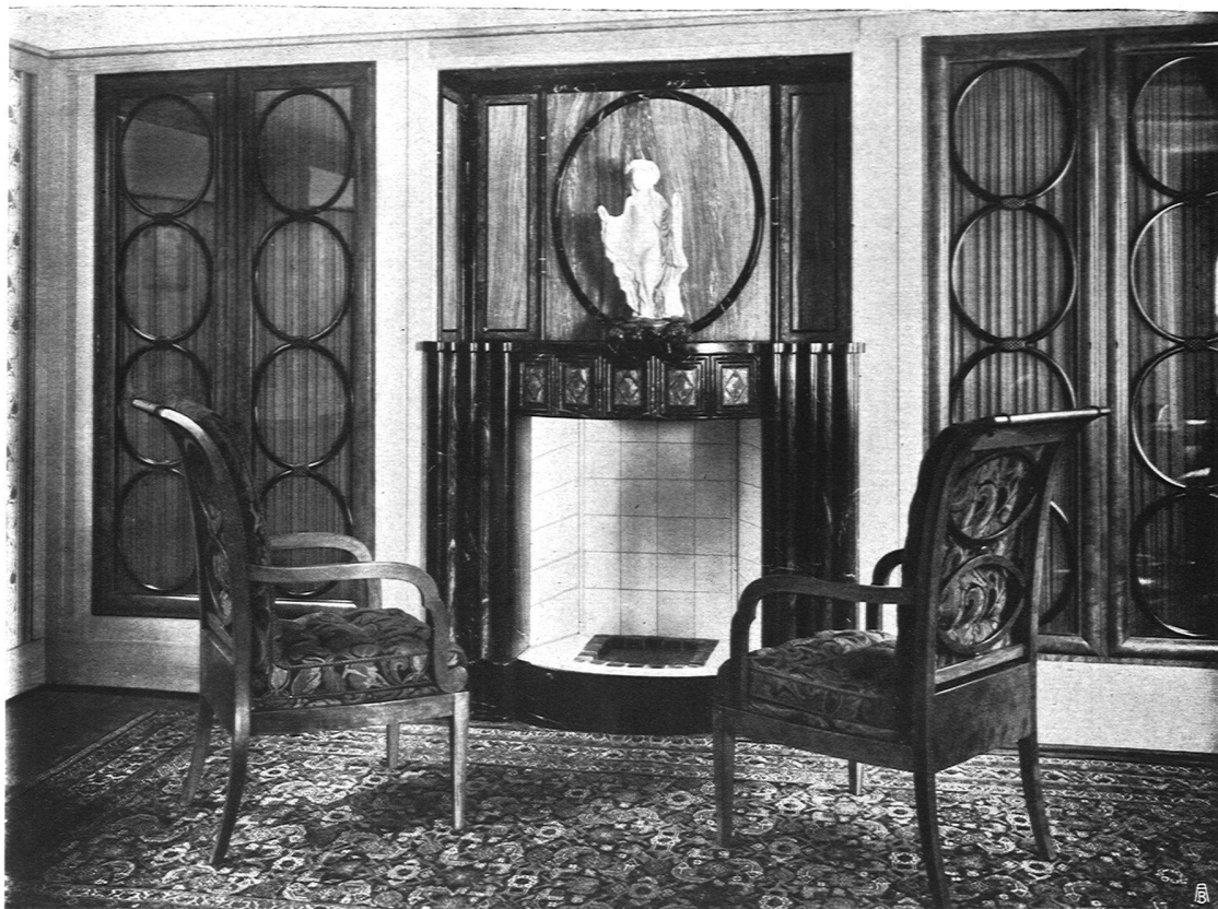
Damenzimmer, Stühle in Birnbaum poliert. Architekt O. Ingold, S. W. B., Bern. Ausführung durch Hugo Wagner, Werkstätte für Wohnungseinrichtungen S. W. B., Bern. Kamin ausgeführt durch die Marmor-Industrie Bieberstein & Pargetzi, Solothurn

Stab an Unteroffizieren und ein Heer an Soldaten. Ein Beispiel: die chemische Wissenschaft verdankt französischen und englischen Forschern ungleich mehr als den deutschen. Trotzdem hat die deutsche chemische Industrie die Welt erobert. Warum? Es fehlte den erstern das Heer an wissenschaftlich geschulten Hilfskräften, die alle die mühselige, zur Erreichung eines Ganzen aber notwendige Kleinarbeit ausführten.