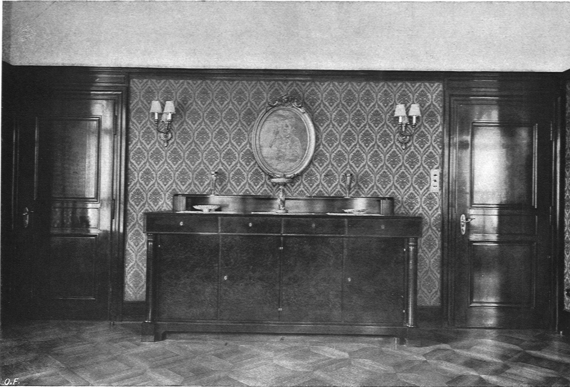
Dressoir aus einem Speisezimmer. Architekten Pfléghard & Häfeli, S. W. B., Zürich Ausführung: Knuchel & Kahl, Möbelwerkstätten, Zürich