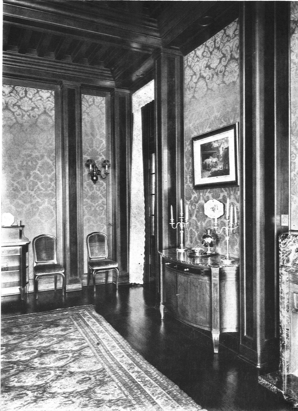
Speisesaal im Landhaus Bocken, ob Horgen am Zürichsee. Architekten Streiff & Schindler, B. S. A., Zürich Ausgeführt durch J. Keller, Möbelfabrik, Zürich

trifft in erschreckender Weise zu für die sogenannten akademischen Berufsarten. Wie viele junge intelligente Leute suchen diese Berufe, überlassen das Handwerk den Ausländern und drängen sich zu