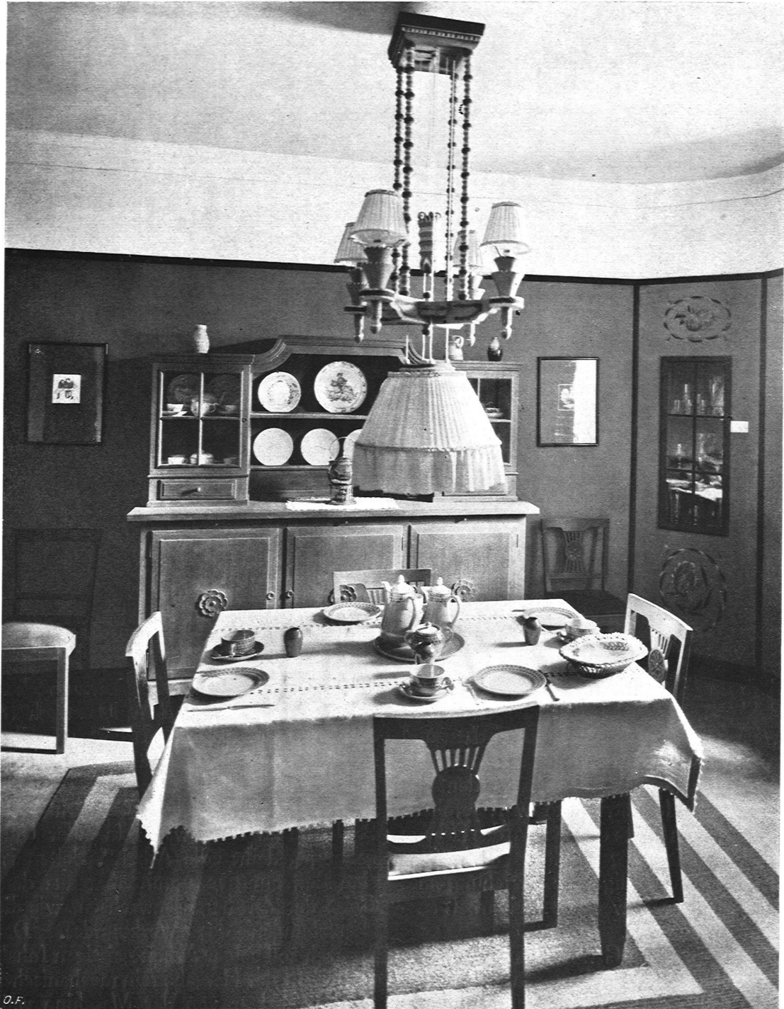
Gewerbeschule der Stadt Zürich, Kunstgewerbliche Abteilung, Fachklasse für Innenausbau. Lehrer: Architekt Wilhelm Kienzle, S. W. B. Ausführung: Lehrwerkstätten für Schreiner. Speisezimmer, Eichen gebeizt. Beleuchtungskörper: Entwurf Fachklasse, Ausführung Baumann, Koelliker & Cie, S. W. B., Zürich. Geschirr in Steingut: Siebler & Cie, Zürich. Fenstervorhänge rot, aus Gadmentaler Webstoffen