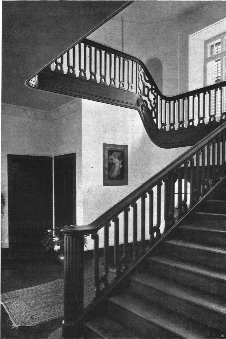
Haus Spinner, Kilchberg, Treppenhalle. Architekten Streiff & Schindler, B. S. A., Zürich Schreinerarbeit ausgeführt durch J. Keller, Möbelfabrik, Zürich

könnte, den Wirtschaftswert menschlicher Arbeit zu steigern. Die allergrößte Bedeutung kommt hier der Auswahl der Geeigneten in den verschiedenen Berufen zu. Nicht umsonst tönt allerorten