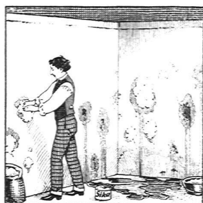
Wasserdurchlässige Stellen in Böden und Wandputz werden mit schnellbindender „SIKA“ verdichtet.