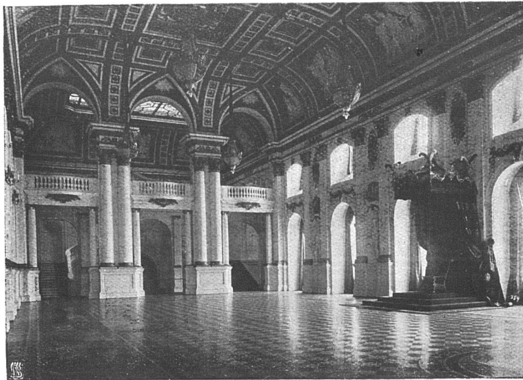
Aufnahme mit Agfa- „Isolar“ Platte