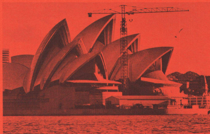
Illustration p. 167 (sans partie de gauche sur p. 166)

verre qu'il fallait utiliser dans leur liaison avec les coques de béton d'Utzon et la création de structures capables de maintenir ces vastes panneaux de glace. C'est la firme française Boussois, Souchon, Neuvecel qui a réalisé, grâce au procédé du float glass, les immenses vitres qui ont permis de mettre la dernière main à l'opéra de Sydney. Des calculs, des expériences en laboratoire, des essais de matériaux ont résolu les difficultés inhérentes à l'étanchéité, à la dilatation et à l'isolation thermique. Car l'opéra de Sydney a été un vaste laboratoire d'essais, tel que seul peut en nécessiter un véritable prototype.