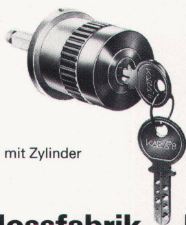
No. 3415 mit Zylinder

Die Zylinderolive die mühelos bedienbar ist – grundehrlich, einfach und modern.