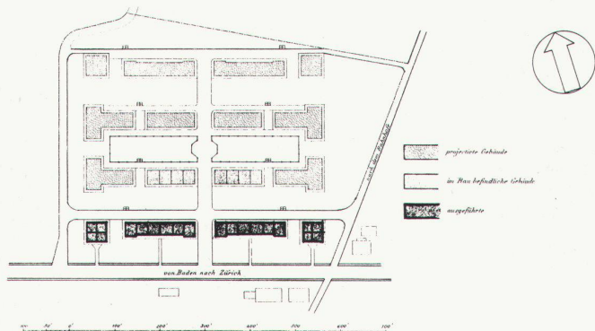
Situation des Gesamtprojektes 1861

Ab 1861 versicherte die Invalidenkasse der Spinnerei- und Webereibesitzer die Arbeiterschaft gegen Unfall und vorzeitige Arbeitsunfähigkeit. Die durchschnittlichen Jahresmieten für Wohnungen betrugen in der Stadt Fr. 220.– für 3-Zimmer-Wohnungen, Fr. 250.– für 4-Zimmer-Wohnungen; auf dem Land Fr. 130.– für 3-Zimmer-Wohnungen, Fr. 180.– für 4-Zimmer-Wohnungen.