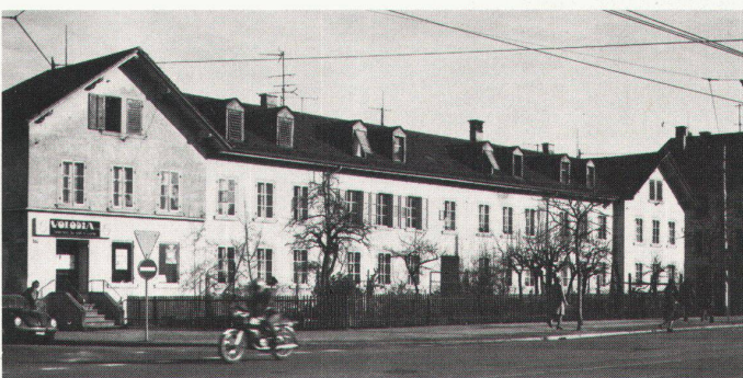
Teilansicht von der Badenerstrasse aus