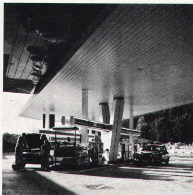
Autobahn-Tankstelle Würenlos LUXALON®-Fassadenverkleidung Typ 150 F (als Decke montiert)

Besser gesagt, weil LUXALON®-Aluminiumdecken nur Vorteile bieten: