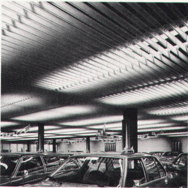
Eulach-Garage Winterthur, LUXALON®-Rasterdecke Typ 100 V