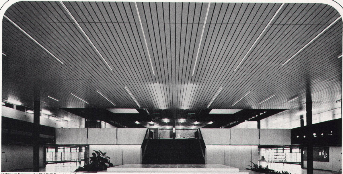
Technikum Rapperswil LUXALON®-Panneeldecke Typ 134 H