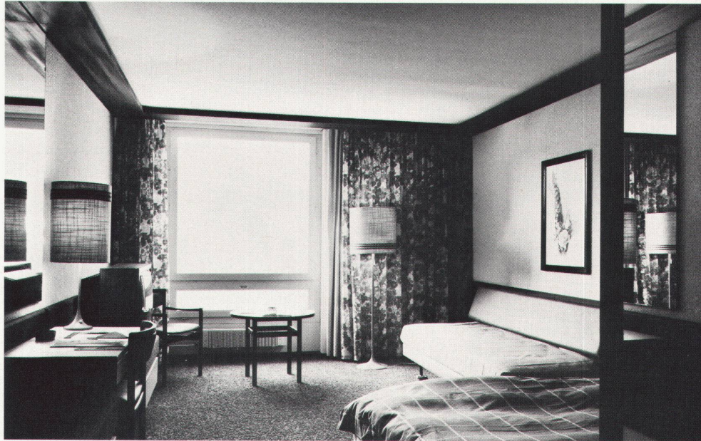
Schnitt durch Saal, Hallenbad und Hotel

Coupe à travers la salle, la piscine couverte et l'hôtel.