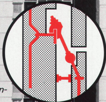
Fassaden- platten- Anker