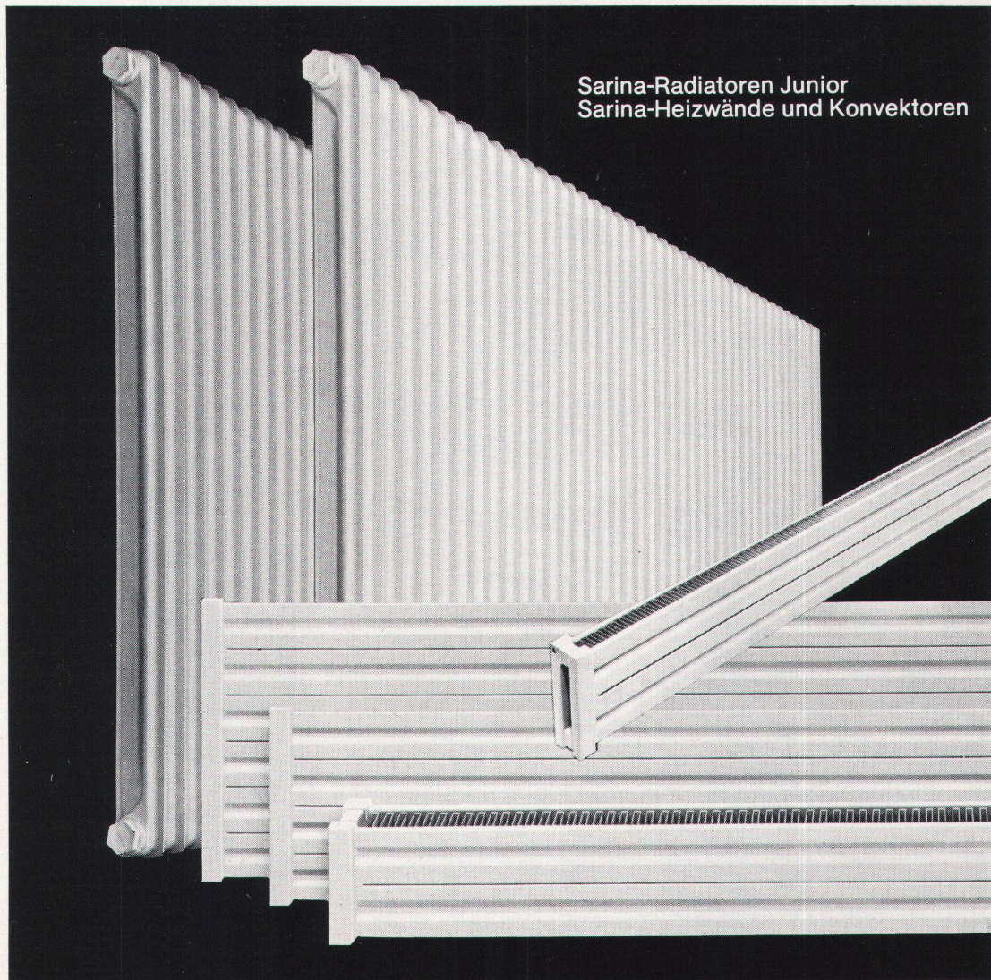
Sarina-Radiatoren Junior Sarina-Heizwände und Konvektoren

Verlangen Sie unser Prospektmaterial oder unseren Vertreterbesuch.