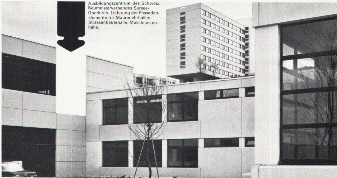
Ausbildungszentrum des Schweiz. Baumeisterverbandes Sursee-Oberkirch. Lieferung der Fassadenelemente für Maurerlehrrhallen, Strassenbauerhalle, Maschinistenhalle.

Für Ihre Ideen heisst: nach Ihren Plänen hergestellt in der geeigneten Qualität mit der gewünschten Oberflächenstruktur. Wir liefern massgenau und auf den vereinbarten Termin konstante Qualität. Dank unserer bekannt guten Rohstoffproduktion sind wir befähigt, höchste Ansprüche zu erfüllen. Objektive Beratung schon in der Planungsphase durch unsere Fachleute.