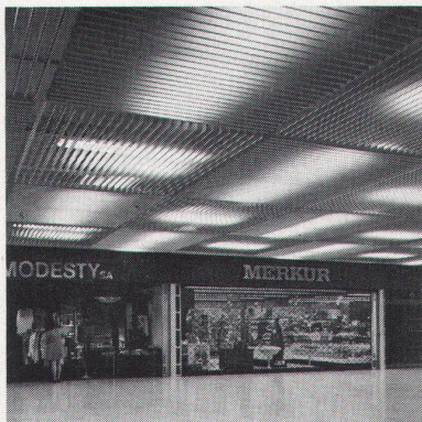
Carrefour Brügg, LUXALON®-Rasterdecke Typ V 100

Denn LUXALON®-Aluminiumdecken sind einbrennlackierte Aluminiumpaneele, die auf einbrennlackierte Aluminiumtragschienen geklemmt werden. In vielen Farben. In vielen Profilformen.