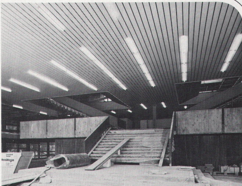
Technikum Rapperswil, LUXALON®-Panneeldecke Typ 134 H

Besser gesagt, weil LUXALON®-Aluminiumdecken die bessere Lösung sind. Als dekorative Akustik- und Lüftungsdecken. Weil sie hohe Korrosionsfestigkeit bieten, weil sie schnell montiert werden können, weil sie ideale Gestaltungsmöglichkeiten bieten, weil Leitungen und Installationen immer zugänglich bleiben.