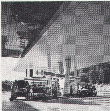
Autobahnrestaurant Würenlos LUXALON®-Fassadenverkleidung Typ 150 F (als Decke montiert)

LUXALON®-Aluminiumdecken sind nicht nur die bessere Lösung, sie sehen auch wie die bessere Lösung aus. In Schulen, Bürogebäuden, industriellen Bauten, Krankenhäusern, Supermärkten, Hallenbädern, Hotels, Sportanlagen usw.