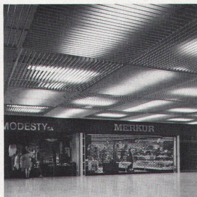
Carrefour Brugg, LUXALON®-Rasterdecke Typ V 100

Denn LUXALON®-Aluminiumdecken sind einbrennlackierte Aluminiumpaneele, die auf einbrennlackierte Aluminiumtragschienen geklemmt werden. In vielen Farben. In vielen Profilformen.