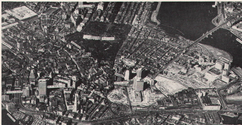
Luftaufnahme aus: «New England Real Estate Journal»

Murphy, selbst Mitglied des Steuerungsgremiums der Studie, sieht den innovativen Charakter der Untersuchung, an der neun Städte beziehungsweise Gemeinden beteiligt sind, in zwei Punkten: in den Alternativen, die geprüft werden, und in der Methode, wie die Öffentlichkeit beteiligt wird; die Verbesserung von Modellen der Verkehrsprognose und der Flächennutzungssimulation tritt in den Hintergrund.