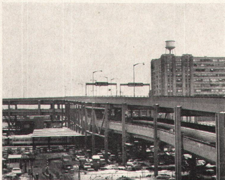
Detailaufnahme der Hochstraße im Bereich des Bahnhofes

Diese Strömungen artikulieren sich in einer