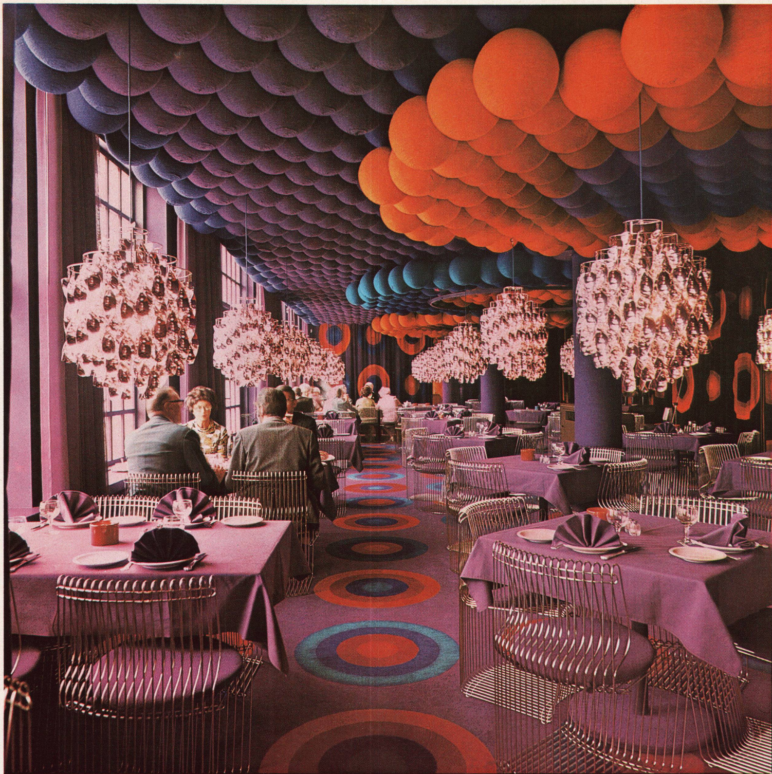
Restaurant in Aarhus, Dänemark Design: Werner Panton

Rudolf Meer + Kaufmann AG, 3000 Bern, Effingerstraße 21