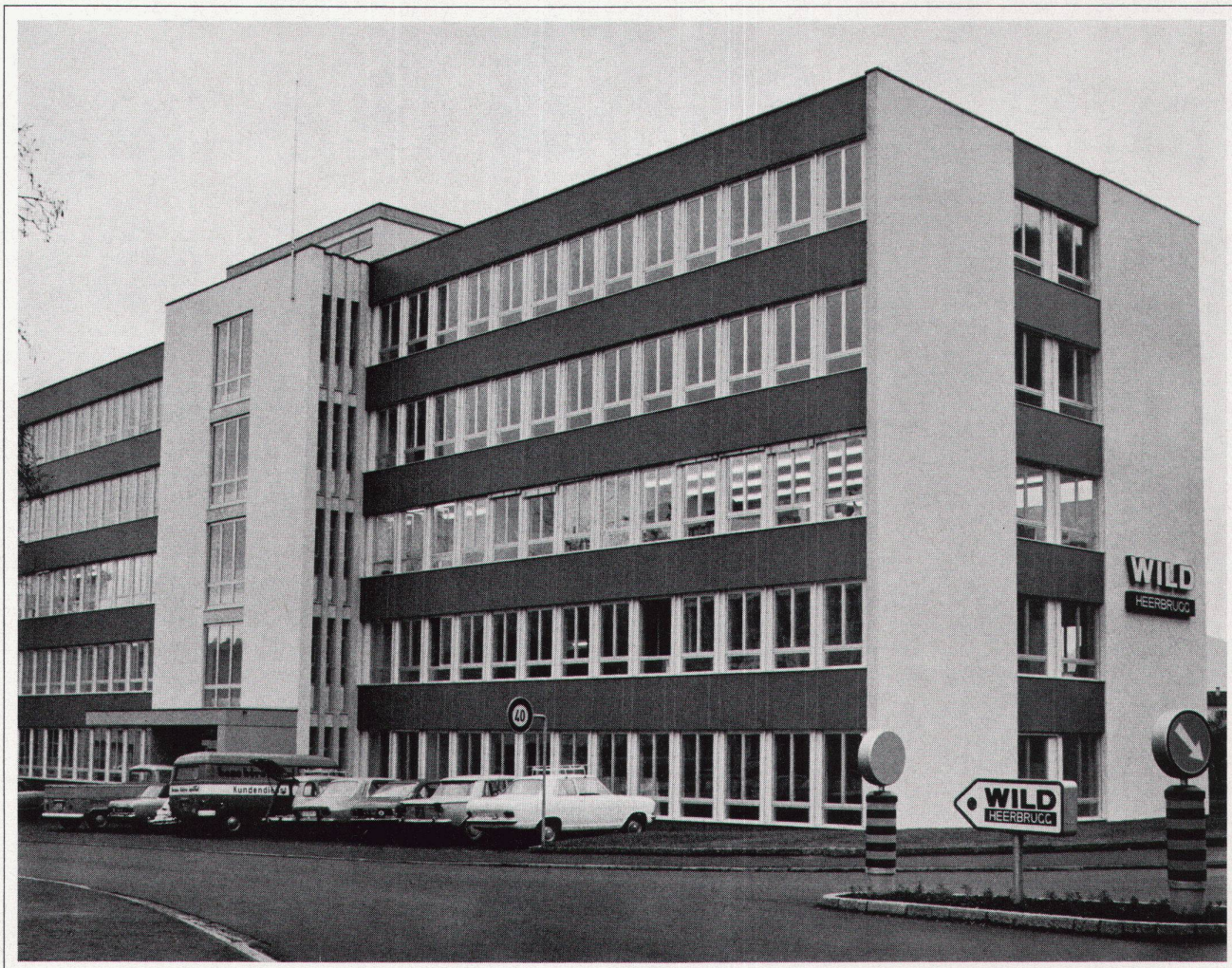
Fenster aus Holz/Leichtmetall Forschungsgebäude Wild Heerbrugg