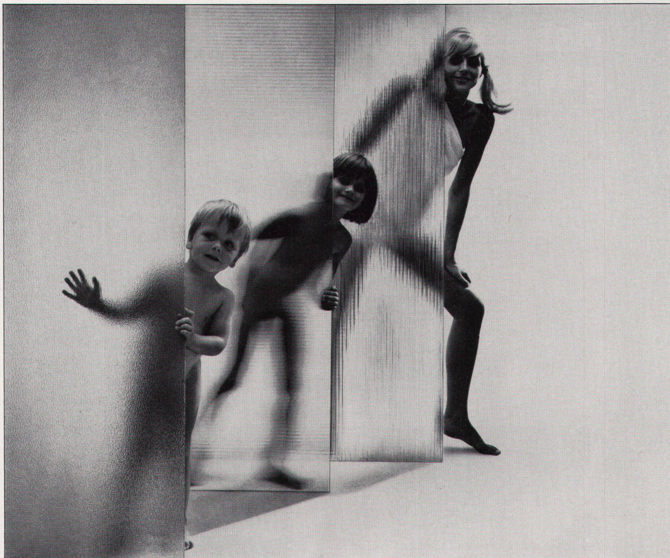
Ornamentscheiben aus Makrolon für Duschanlagen, Bäder, Krankenhäuser, Sportheime, Großindustrien