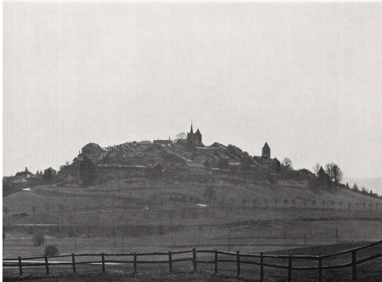
Zu den Bildern: Sollen die Nebenzentren entwickelt werden? Links das noch ruhige Romont, rechts das in Bedeutungslosigkeit versunkene Châtel-St-Denis

C'est également, entre Berne et Lausanne, une ville qui se sent un peu prise en tenaille entre ses deux puissantes voisines, et qui craint de faire les frais de leur progression en tache d'huile. Et pourtant, à l'ombre croisée de ces deux métropoles, Fribourg demeure une capitale . D'une ville primatiale, chef de file dans sa région, elle a tous les caractères. Son influence s'étend jusqu'aux frontières cantonales, à l'exclusion d'une mince frange septentrionale qui gravite autour de Berne et d'un secteur méridional tourné vers la conurbation lémanique. Son dynamisme se traduit, comme il se doit, par une croissance (encore qu'inégale) de trois éléments essentiels de la centralité: la po-