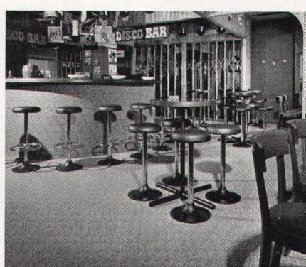
in Hotels und Restaurants