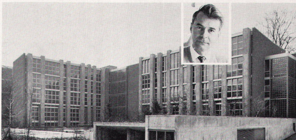
das neue Schulhaus Rämibühl in Zürich

Planung und Ausführung: Eduard Neuenschwander Dipl. Architekt SIA SWB