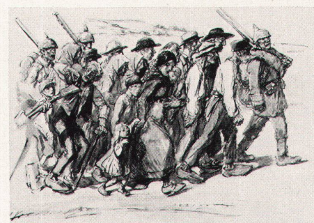
1 Théophile-Alexandre Steinlen, L'Exode, 1915. Aquarell

Auch der zweite von der Kunsthalle vorgestellte Künstler gehört in die Kategorie der berufsmäßigen Lieferanten von Bildmaterial. Allerdings in einem ganz anderen Sinne als der «Déserteur». Théophile-Alexandre Steinlen war seit den achtziger Jahren des letzten Jahrhunderts, bis zu seinem Tode, 1923, in Paris tätig. Er versuchte sich im Gegensatz zu «Le Déserteur» in allen damals modernen Techniken der Graphik und der Illustration und ist einzureihen unter die französischen Gesellschaftskritiker des Fin de siècle. Allerdings unterscheidet er sich in seinen schärfsten – und einzig gelungenen – Satiren deutlich von den Künstlern des Fachs: etwa Constantin Guys, Dau-