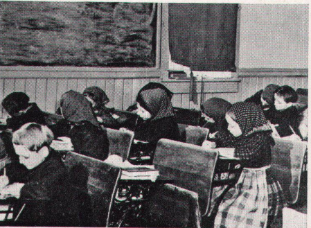
12 Kindergarten in der Jamesville-Colonie