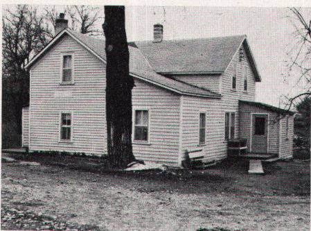
8 Wohnhaus in der Maxwell-Colonie