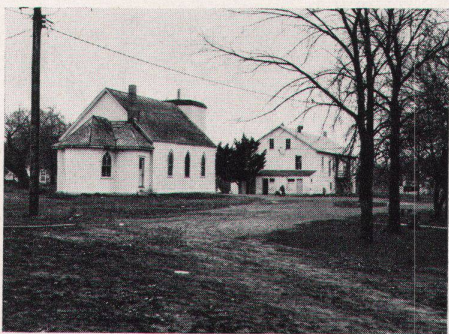
7 Kirche in der Maxwell-Colonie