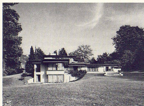
1 Villa Reinhart am Heiligberg in Winterthur. Architekt: Prof. Ulrich J. Baumgartner, Winterthur; Photo: Fritz Maurer, Zürich

Bauten: Staatskellerei des Kantons Zürich; Schulhausbauten in Neftenbach und Winterthur; Postgebäude in Elgg; Neubauten für das Technikum Winterthur; Ortsplanungen Dübendorf und Zumikon; Landwirtschaftlicher Siedlungsbau; Wohnbauten.