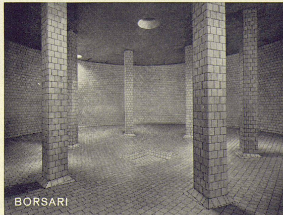
Flughafen-Immobilien-Gesellschaft Zürich-Kloten 7 Tanks total 5600 m 3 Schweröl

Direktion der Métallique SA, Postfach, 2501 Biel.