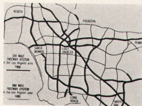
1 Für 1980 sind in Los Angeles 800 Meilen Autobahn geplant; 1000 Meilen Autobahn sind für ganz England geplant

Der Angeleno findet sich mit dem Auto zu recht. Los Angeles hat die höchste Autorate in der Welt, und noch immer mehr Autos werden verkauft. Fast so viele Autobahnen sind geplant wie für Groß-London und davon bereits 60% gebaut. «Mitten im unglaublichen Gedränge neuer Autos wird einem klar, dies ist in der Tat eine Automobilkultur. Mit 40 dem Auto gewidmeten