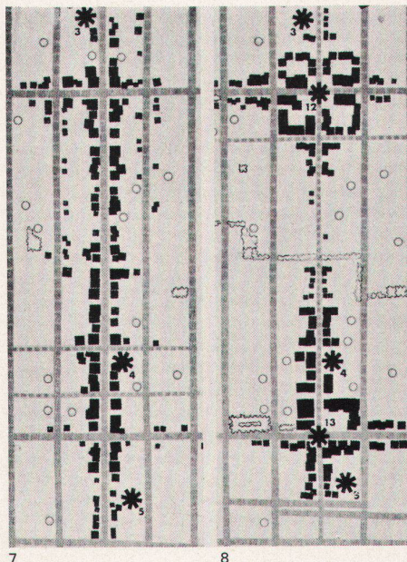
7, 8 Die voraussehbaren Folgen des Untergrundbahnsystems auf einen Stadtteil von San Francisco: die Geschäftshäuser entlang eines «Strip» verschwinden zugunsten von «Clusters» um die Stationen

1. Die Organisation der Verkehrsbetriebe zur technisch-ökonomischen Optimalisierung läßt keine umfassenden Aktionen zu. Ein zum Scheitern verurteiltes Suboptimalisieren durch Rationalisierung kennzeichnet die hilflose Lage. Parkplatzpolitik der Siedlungspolitik, der sozialen Programme, des Schnellstraßenbaues sind weit außerhalb der Reichweite von S-Bahn-Verwaltungen.