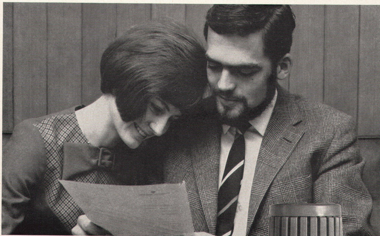
Die Wärmerechnung wurde kleiner als erwartet . . . mit thermostatischen DANFOSS Heizkörperventilen