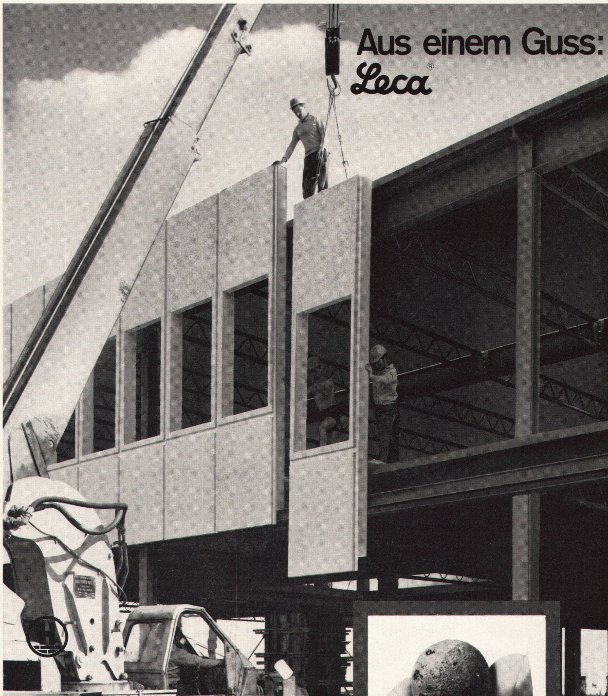
Montage von Leca -Elementen am Bürogebäude der Motag AG, Dielsdorf Planung: P. Moser + C. Kuenzle, dipl. Architekten ETH/SIA, Zürich Statik: G. Caprez, Bauingenieur ETH/SIA Stahlbau: Gauger + Co AG, Metallbau