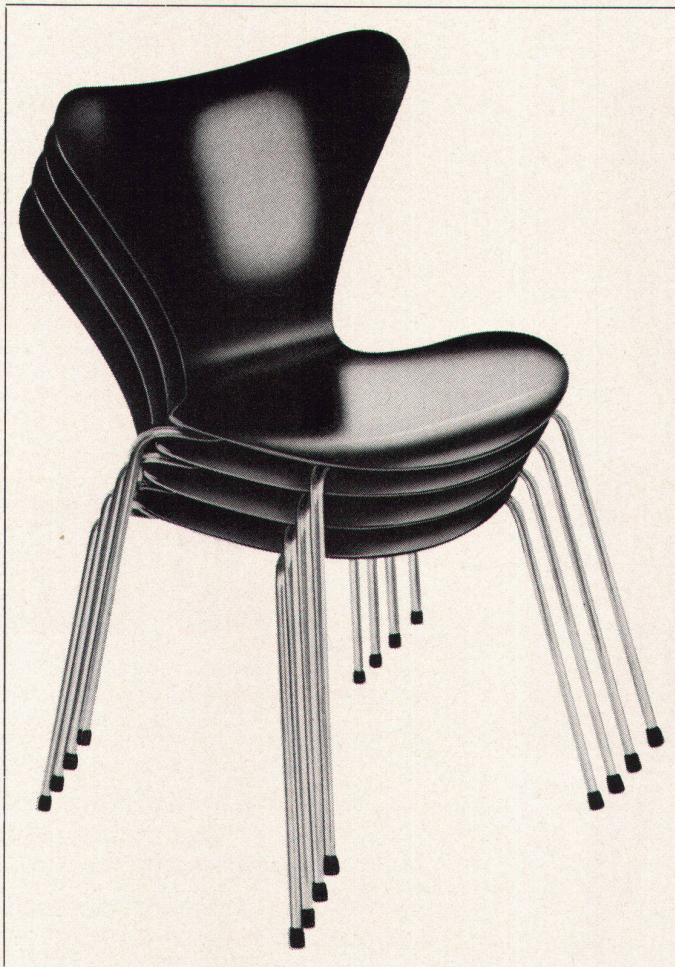
3107 Design Arne Jacobsen