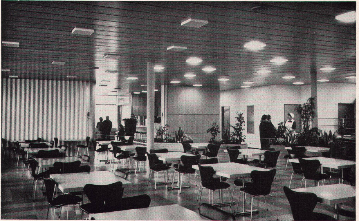
Personal-Restaurant im neuen Schwesternhaus Tiefenauspital Bern. Architekt: Walter Gloor SIA/BSA, Bern