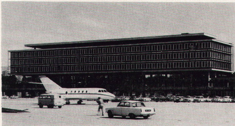
Flughafen Genf-Cointrin - Schweiz Arch. J. Camoletti & J. Ellenberger

Neben dem bereits bekannten goldfarbenen Sonnenschutzglas STOPRAY wird eine neue Ausführung, das purpurfarbene STOPRAY, hergestellt. Bemerkenswerte Reflexionseigenschaften zeichnen die STOPRAY-Sonnenschutzgläser aus : ca. 70 % der Wärmeinstrahlung wird abgehalten. Andere Sonnenschutzvorrichtungen werden in vielen Fällen überflüssig und die Kosten für den Bau und Betrieb einer Klimaanlage werden reduziert. STOPRAY, eine isolierende Verglasung Thermopane, ist ein Qualitätsprodukt der Glaverbel.