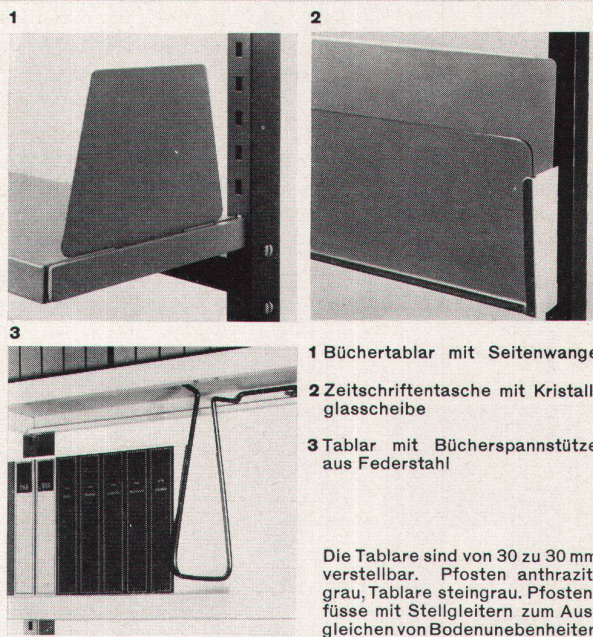
1 Büchertablar mit Seitenwange

Einseitiges Wandregal in einer Länge von 3600 mm: 4 Regalfelder mit je 6 Tablaren, total 24 Tablare. Für ca. 710 Bücher. Fr. 1040.— Kosten je Buch: Fr. 1.47