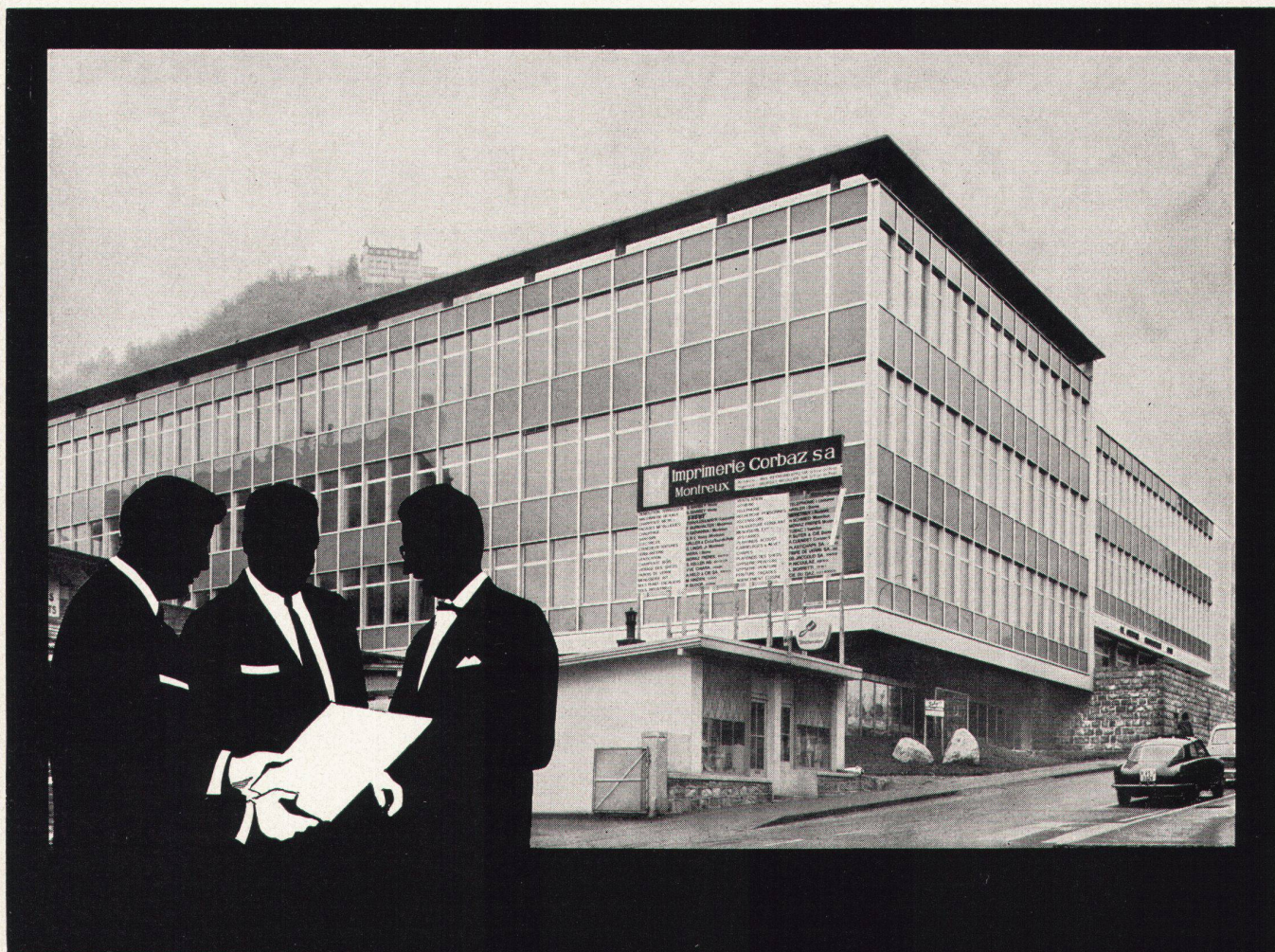
Imprimerie Corbaz SA, Montreux: Lufttechnische Spezialanlagen in der Druckerei und im Papierlager