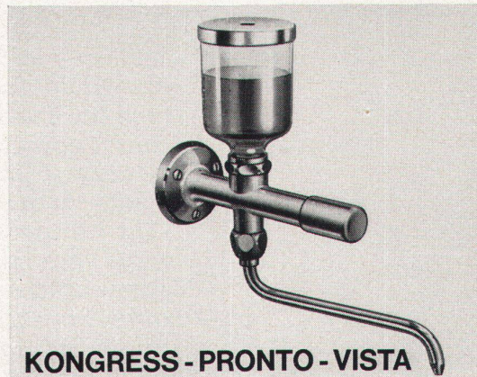
KONGRESS - PRONTO - VISTA

Nr. 7970 Inhalt 1/2 Liter. Deckel mit Bajonettverschluss