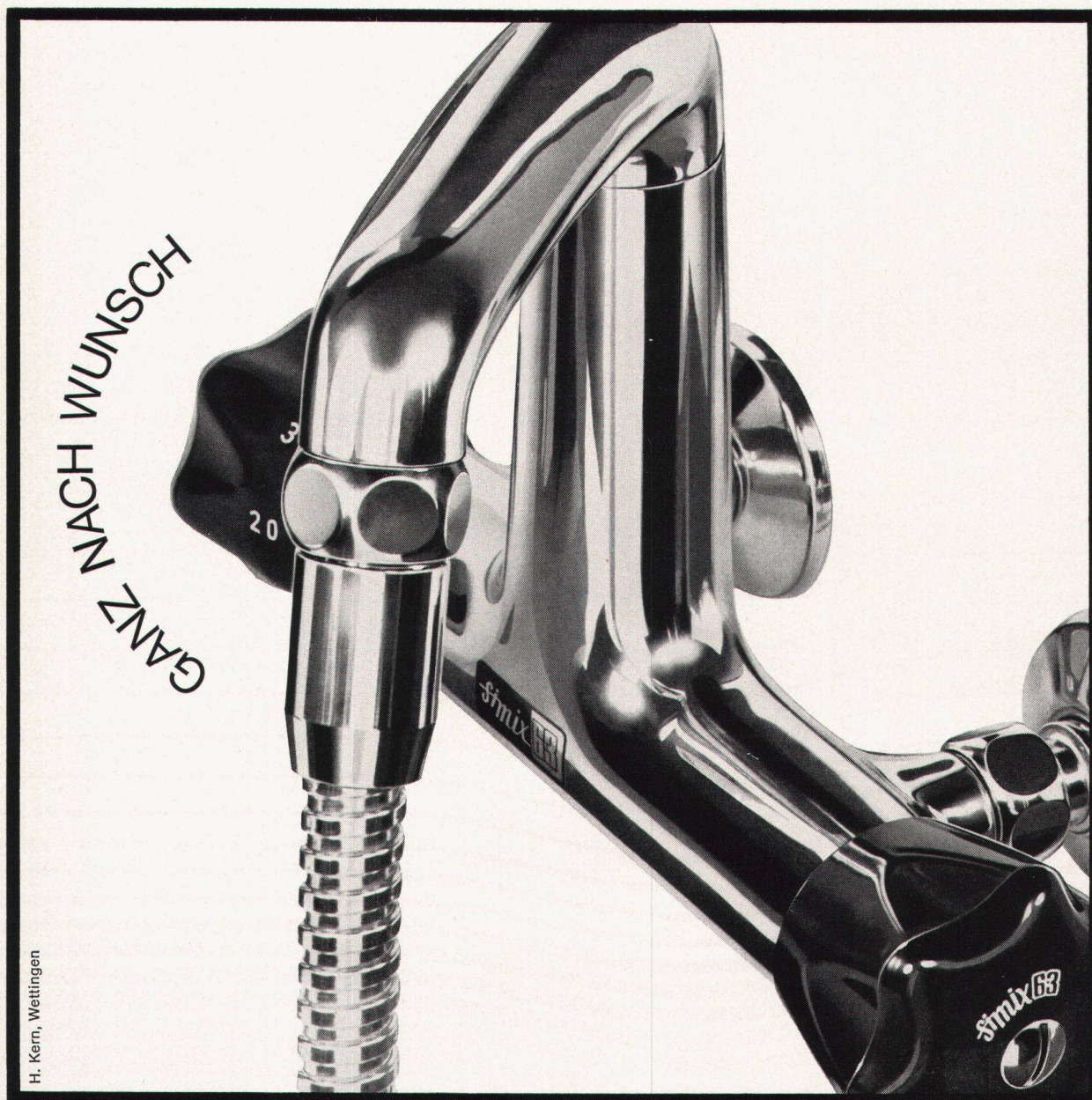
H. Kern, Wettingen

Das automatische Thermomischventil SIMIX 63 erfüllt die Forderung nach einfacher Installation und zuverlässiger Funktion. Selbst bei Druckdifferenzen zwischen Kalt- und Warmwasser arbeitet SIMIX 63 störungsfrei. SIMIX 63 wird wie eine normale Batterie auch in bestehenden Anlagen montiert, wobei zusätzliche Leitungen oder Armaturen überflüssig sind. Nur zwei Raccords