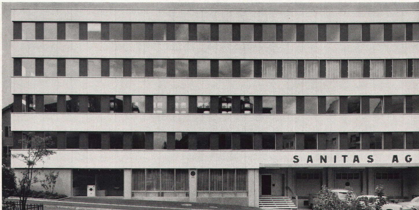
Eternitfassaden System Keller

Unsichtbare Plattenaufhängung, verdeckte Neopren-Stoßprofile, Sichtfuge 3 mm. Geschäftshaus der Sanitas AG, St.Gallen. Architekten Stäheli & Frehner