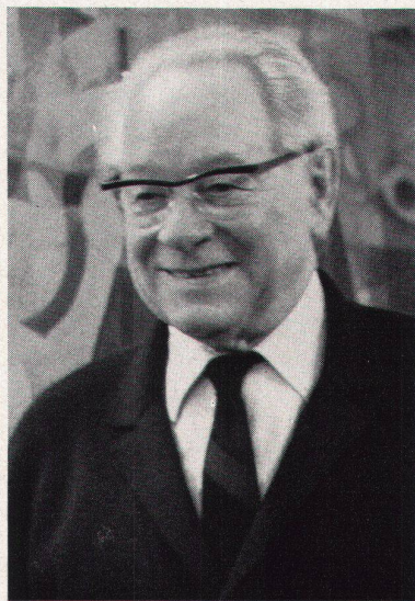
Johannes Itten. Aufnahme vom 7. März 1967

bewußt stets den primären, großen Naturkräften verbunden blieb.