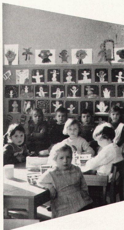
Mobiliar für Kindergärten

mit der 10-Jahres-Garantie für dauerhaften Schreibbelag und den Vorteilen: Angenehmes, weiches, blendungsfreies Schreiben und Zeichnen auf graugrün und schattenschwarzen, magnethaftenden und kratzfesten Flächen, die leicht zu reinigen sind.