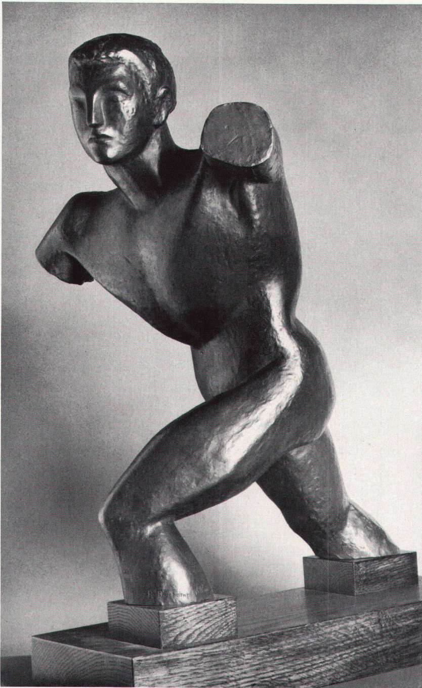
1 Raymond Duchamp-Villon, Jünglingstorso, 1910. Bronze, H. 55 cm. Musée National d'Art Moderne, Paris Torso de jeune homme. Bronze Torso of Young Man. Bronze

Guillaume Apollinaire, der 1913 in seinen «Peintres Cubistes» hellseherisch aus den Werken scheinbar nur «experimentierender» Künstler seiner Zeit eine neue Epoche optischen Ausdrucks aufklingen läßt, widmet in dieser Gegenwartsgeschichte Raymond Duchamp-Villon als einzigem Bildhauer ein letztes Kapitel. (Brancusi und Archipenko werden nur erwähnt.)