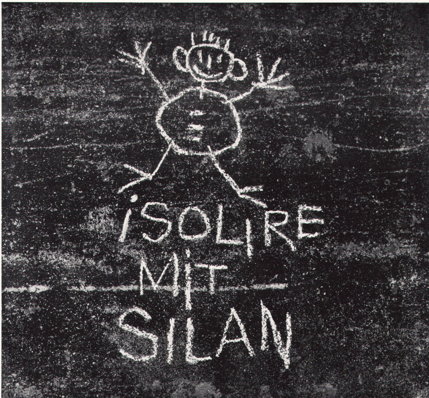
"Inscription" on a house wall in Horgen

Mitgeteilt von Wanner A.G. Horgen Isolierwerke und Korksteinfabrik