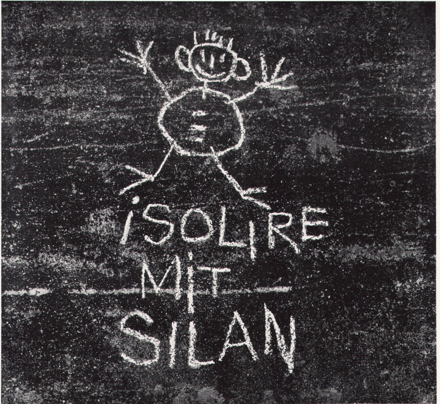
"Inscription" on a house wall in Horgen

Mitgeteilt von Wanner A.G. Horgen Isolierwerke und Korksteinfabrik