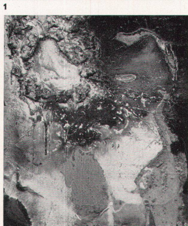
1 Hans Affeltranger, Stilleben mit Früchteschale und Geige, 1958