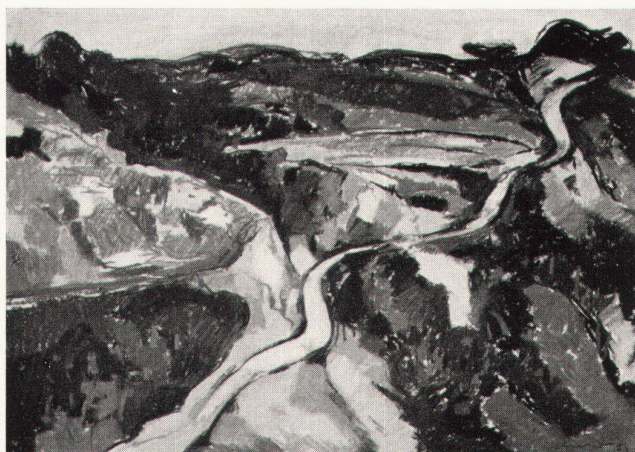
Willy Suter, La route dans les falaises

vielseitige Darstellung boten. Willy Suter hat denn in tonig tiefen, auf dunkles Blaugrün oder den Klang Blau-Ocker abgestimmten Aquarellen, in Pastellen, die fahlblonde Töne heranziehen, in Gemälden, die durch die bewegt und pastos aufgetragene Farbmaterie leben, die einsame Landschaft gemalt, sie gleichzeitig zu lebendigen Kompositionen gesteigert, die durch ihre energischen Gliederungen und kräftigen farblichen Akzentuierungen fesseln. Als Schwerpunkte der Schau wirkten einige fast monochrome große Landschaften, deren eine durch ihr leuchtendes Rot-Orange-Karmin bannte, die andere durch hellgoldenes Gelb, die dritte durch ein kühles, liches Grün, die vierte, eine Darstellung des Ventoux, durch die verschiedenen Stufen eines weißlichen Blau, das mit hellem Lila konfrontiert wird. Deutliche Tendenz zur Abstraktion machte sich in diesen Tafeln geltend. In einigen weiteren Gemälden war sie vollzogen. Daß Willy Suter ganz zur Abstraktion übergehen werde, ist indessen kaum anzunehmen: zu sehr wird er vom Gegenstand selber getragen, was im übrigen aus den Pastellen, vor allem den meisterlichen zeichnerischen Blättern, hervorging, auf denen er eine Landschaft oder eine Figur aus jener Gegend mit virtuoser Sicherheit umriß. Einige kleine Stilleben trugen zur weiteren Bereicherung der lebendigen Ausstellung bei.