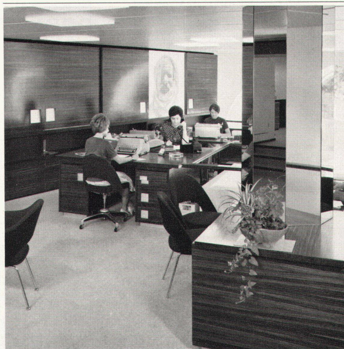
Bauschreinerei und Innenausbau