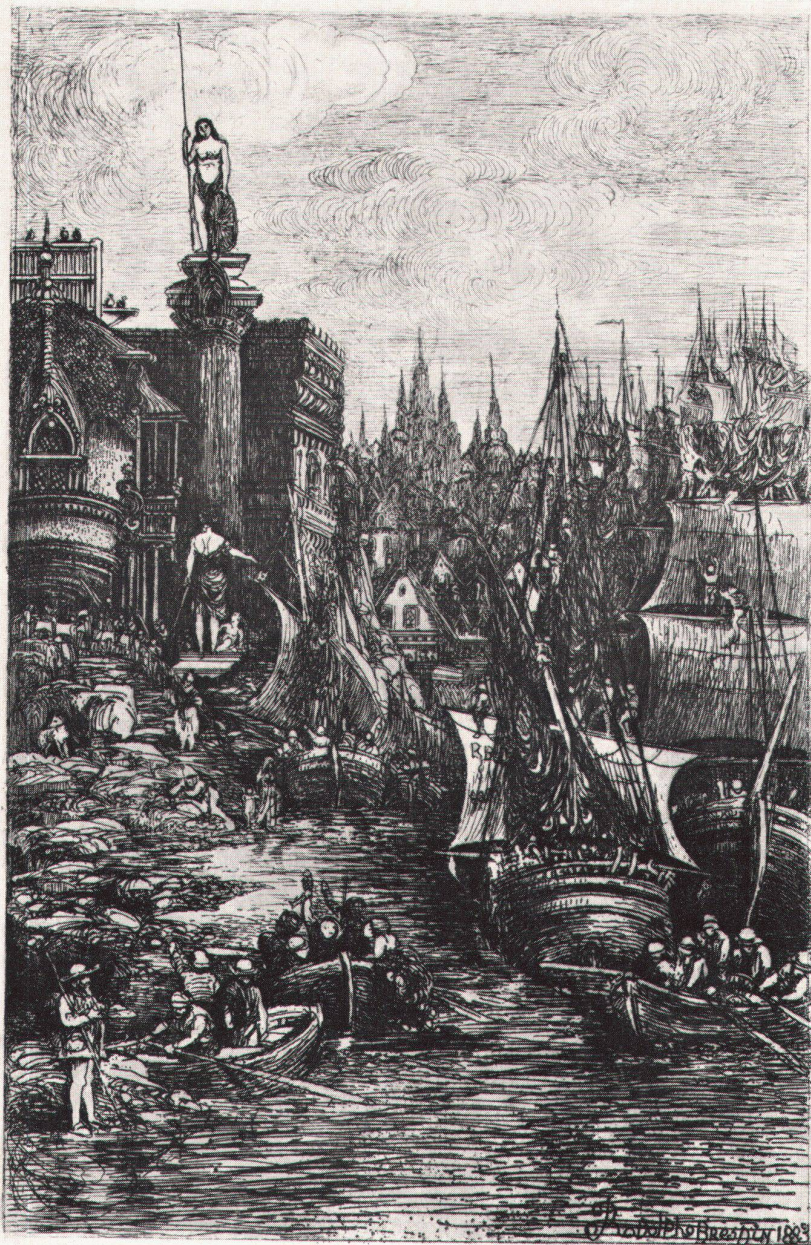
6 Rodolphe Bresdin, Mon Rêve, 1883. Radierung, 184 : 119 mm. Sammlung Richard Bühler, Winterthur Mon Rêve. Eau-forte My Dream. Etching

Orient und Zweites Kaiserreich. Vor einem balkon- und türmenbestückten Fabrikantenschlößchen rüsten sich mittelalterliche Ritter zur Jagd, und an einer Villa der sechziger Jahre mit ausgesägten Chaletverzierungen zieht eine Rokoko-schäferin vorbei. Man fühlt sich hier ganz nahe bei Saul Steinberg.