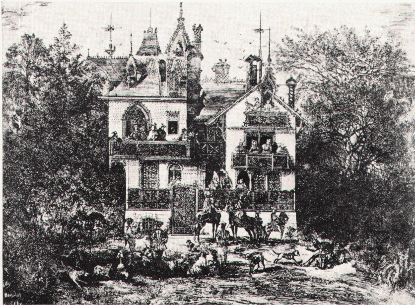
Rodolphe Bresdin, Aufbruch zur Jagd, 1869. Lithographie? Nach: Robert de Montesquiou, L'Inextricable Graveur. Rodolphe Bresdin. Paris 1913 Le départ pour la chasse. Lithographie? Gone Away. Lithograph?