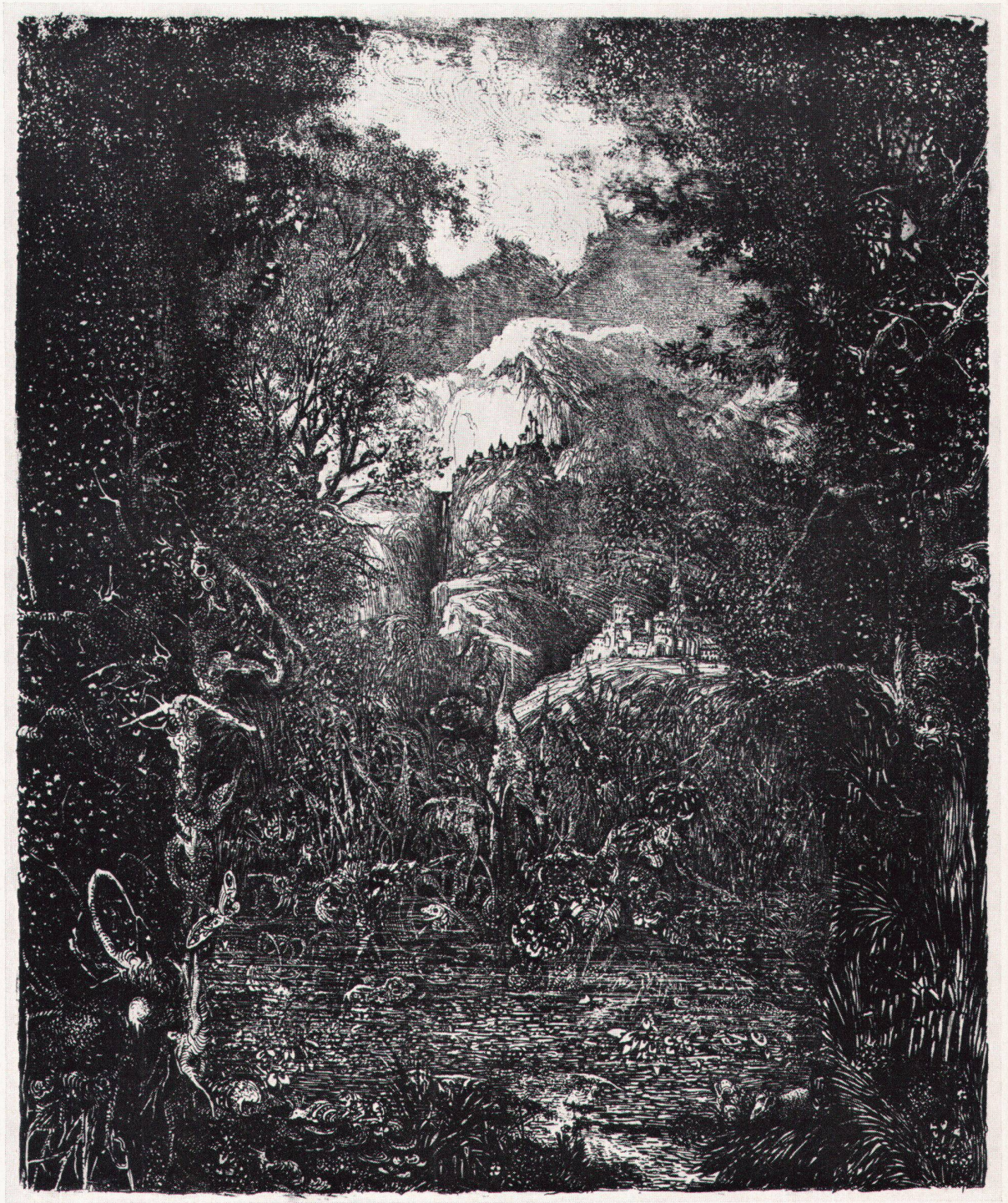
5 Rodolphe Bresdin, Die Stadt hinter dem Sumpf. Lithographie, 193 : 156 mm La ville derrière le marécage. Lithographie The Town beyond the Swamp. Lithograph

stimmen sein Vegetationsbild. Tiere sind in dieses Wachstum hineingeschlungen, und bei manchen Blättern gelingt es kaum mehr, Tier und Pflanze zu unterscheiden. Der Mensch erscheint verloren klein zwischen dem Wuchern der Natur, oder dann deckt er als wimmelnde Menge auf Flucht oder Kriegszug weite Talböden. (Wieder wird, wie in den Wolkenbildungen, die Erinnerung an Altdorfer, an die «Alexanderschlacht», aber auch an Ensors «Cathédrale» geweckt.) Selbst die Architektur ergreift ein wildes Wachstum: türmereiche Burgen und Schlösser, verrottete Stadtfronten am Wasser, flämische Bauernstuben voll von Speisen, Krügen und Ruß. Die Zeiten gar wachsen ineinander, Antike und Mittelalter, sagenhafter