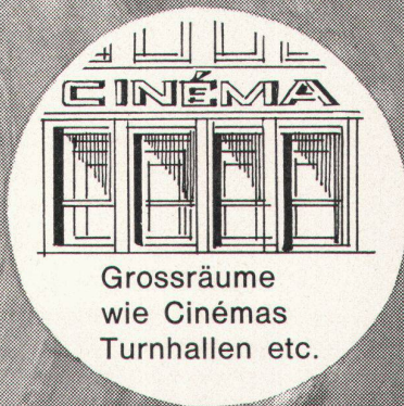
Grossräume wie Cinémas Turnhallen etc.