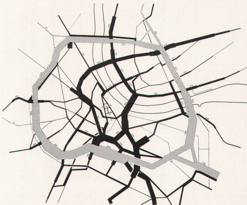
Verkehrsbelastung der beiden projektierten Basler Ringstraßen. Prognose der Fachverbände auf Grund der Umlegung