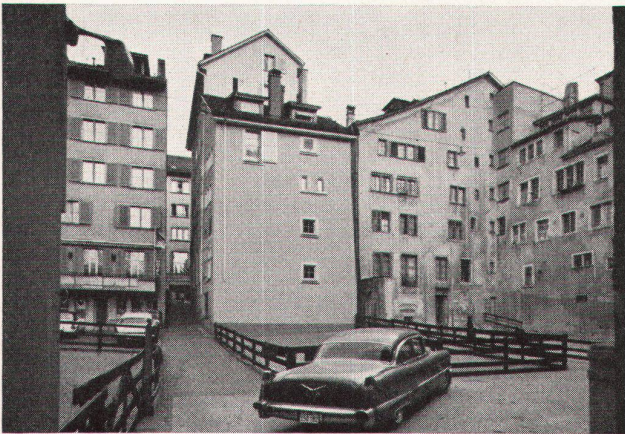
2, 3 Auskernung, das frühere Rezept der Altstadtsanierung. Die Maßnahme war sicher hygienisch und gut gemeint; nur weiß man jetzt nicht, was man mit dem gewonnenen Raum anfangen soll (Auskernung Krebsgasse in Zürich)