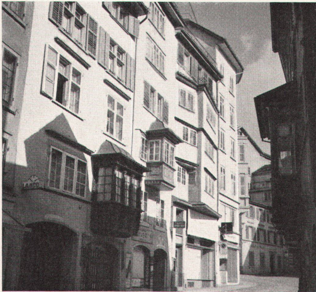
1 Das lebendige Gesicht der Altstadtgasse; jede Generation hat ihren sinnvollen Beitrag geleistet (Augustinergasse in Zürich)