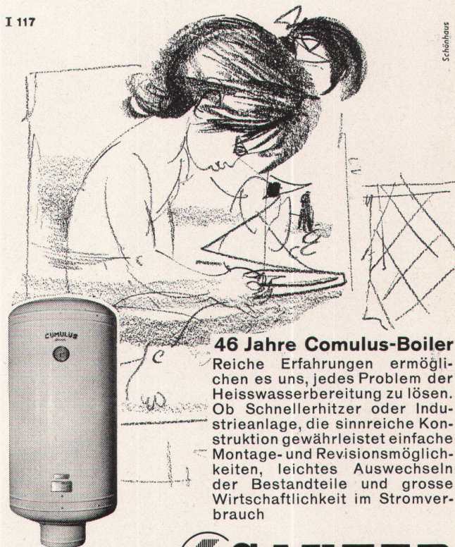
Wandboiler «Cumulus» Inhalt 100 l