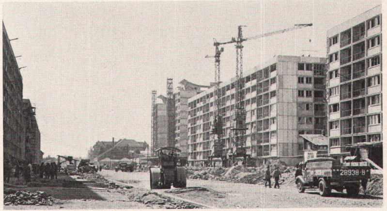
5 Wohnbau; neuer Versuch einer Montagebauweise mit großformatigen Platten. Architekt: Mircea Bercovici