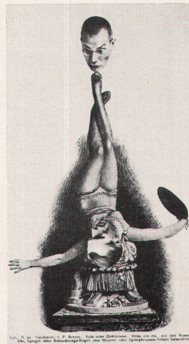
Oben: S. 92. Guckstein: v. P. Bruner. Licht oder Zirkelbogen. Hölzer aus dem, auf der Kunst- und Bild- oder Beleuchtungs-Kugel, eine Frauen- oder Springbrunnen-Schale beleuchtend.

Photomontage von Peter Moeschlin aus der Dekoration des SWB-Festes in Basel