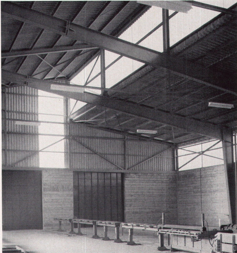
1 Intérieur du hall Innenraum der Halle Hall interior

Une collaboration très étroite avec les ingénieurs a permis de construire ce bâtiment pour un prix au m 3 n'atteignant même pas 30 fr. L'ossature est en métal, les parois de remplissage en béton coffré, la toiture en Eternit ondulé et en Scobalit. La halle est tempérée au moyen d'un chauffage infrarouge et éclairée par des tubes fluorescents.